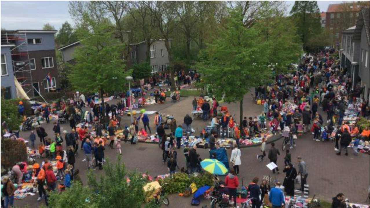
Koningsdag bij 't Groene Sticht 2018