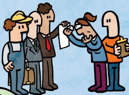
Inventarisatie van schulden