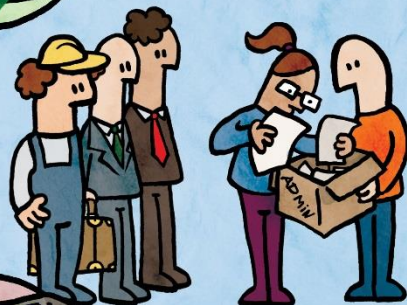
Voorstel voor aflossing