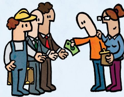
Nakomen van het schuldtraject